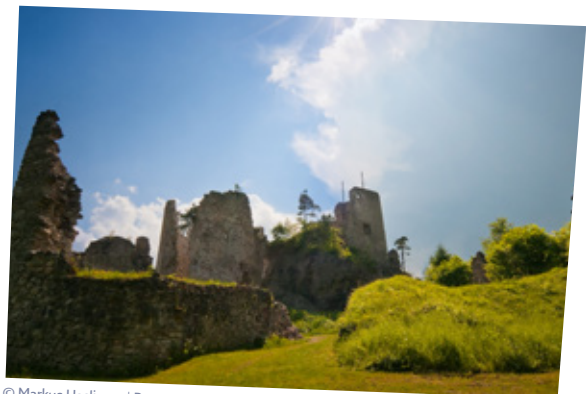
© Markus Haslinger | Burgruine Rabenstein

Familie Krassnig Marktplatz 5, Rabenstein an der Pielach M 0664/124 67 61