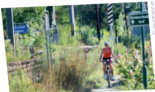
Entlang der Mariazellerbahn