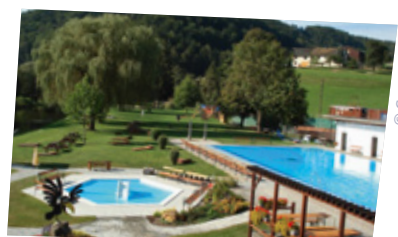
Ab ins Pielachtalbad!

Die Pielach gehört zu den natürlichsten und saubersten Flüssen Österreichs – erfreulicherweise gibt es auf dem Weg von Hofstetten bis nach Rabenstein viele Gelegenheiten ins kühle Nass hineinzuhüpfen. Der zweite feine Vorteil der Route: Sie folgt getreulich der Mariazellerbahn , mit der sich die Tour angenehm verkürzen oder verlängern lässt. Und als drittes dickes Plus lassen sich an der Route viele Abenteuer bestehen, wie z. B. eine Schatzsuche , eine Floßfahrt über die Pielach oder ein Besuch im Westerdorf .